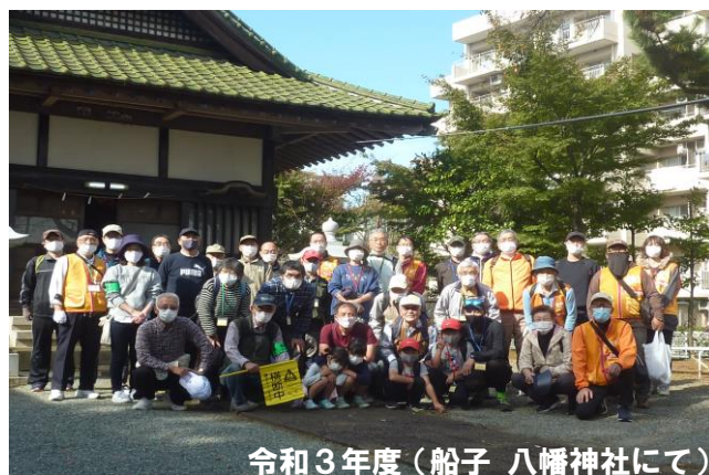
令和3年度(船子 八幡神社にて)

愛甲公民館などを発着点として、ぼうさいの丘公園～地藏橋親水広場～船子八幡神社に至るルートをはじめいろいろなルートで、大勢の地域の方と一緒にウォーキングを実施しています。風景を眺めながら数キロの道のりを完歩しました。