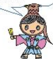
本校ゆるキャラ おやまどりこまのすけ (大山鳥独楽之介)