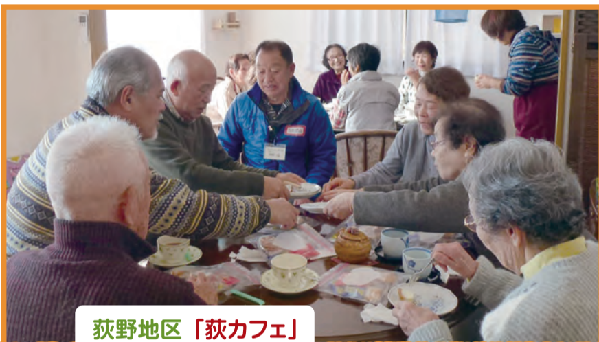
荻野地区「荻カフェ」

「見守り、見守られ、支え合う地域づくり」は、人と人がつながるところから始まります。今、市内のあちこちで地域住民が気軽に立ち寄れる居場所づくりが広がっています。サロンがそのきっかけとなることもあり、お互いを見守り支え合える地域づくりが進んでいます。