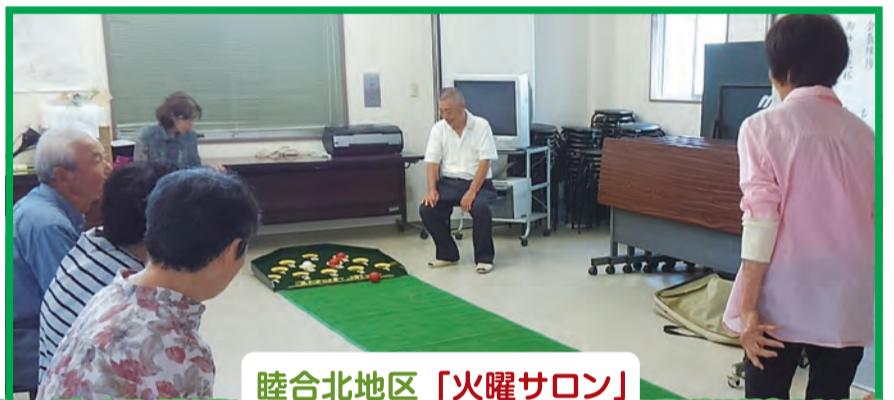
睦合北地区「火曜サロン」

睦合北地区地域福祉推進委員会の事業の1つとして、中三田地区では自治会館を高齢者のために開放し、お茶を飲みながらのおしゃべりやスカットボール、将棋などを自由に楽しんでいただいています。毎回20名程の参加があり、参加者から自主的に抹茶が振る舞われるなど、ふれあいの場として定着しつつあります。また、参加者の中には大正琴のサークルメンバーもあり、3月のサロンでは他のサークルメンバーと一緒に演奏をしていただく予定です。