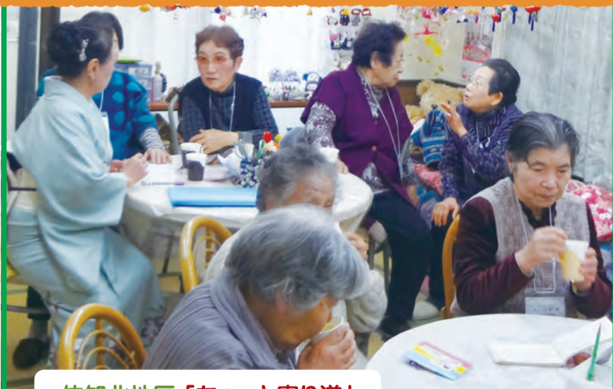
依知北地区「ちょっと寄り道」

「気軽に立ち寄りお茶が飲める場所ができないか。」5カ月間ほど色々な話し合いをして、山際団地自治会にもご協力をいただき、皆で看板やポスターを作りました。そうして「ワンコインカフェちょっと寄り道」ができました。