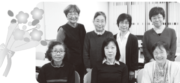
◇ボランティア（団体） あつぎ筆記通訳「道」